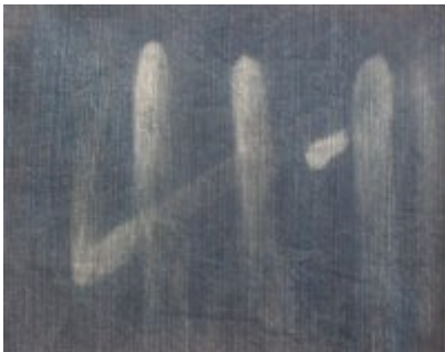
Dikke stretchdenim. Chloor anderhalf uur laten intrekken.