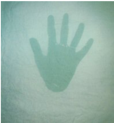
Groen linnen. Chloor half uur laten intrekken.

Aan de andere kant kan dat ook weer leuk zijn natuurlijk.