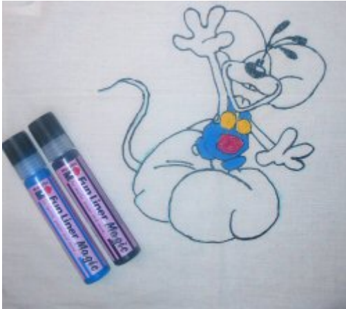
De Diddl bewerkt met kleurtjes Fun Liner Magic.